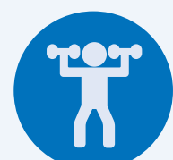
Entraînement avec des poids

L'essentiel est de trouver une activité que vous aimez! Voici quelques suggestions d'exercices à faible impact: