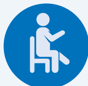
Yoga sur chaise